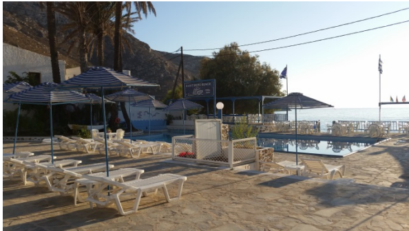
Blick auf das Pool und Meer

Studio für die ganze Woche €245,-- für 1 Person